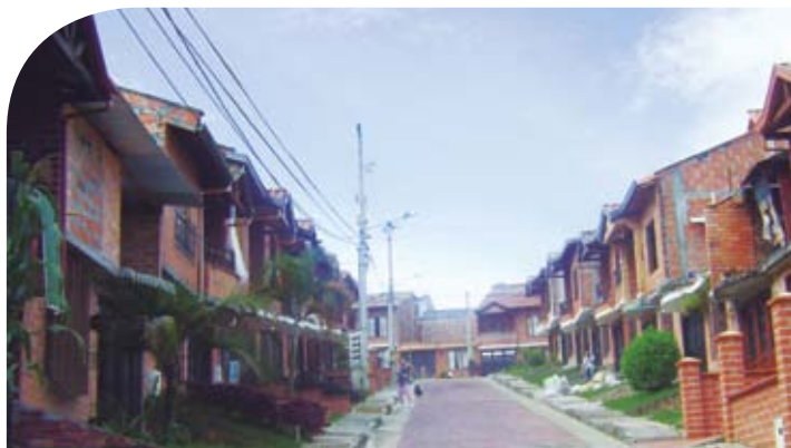
Barrio El Oasis

“Todos ellos se benefician con tarifas muy competitivas y con nuestro portafolio de servicios, que comprende soporte de 24 horas para atender emergencias los 365 días del año”.