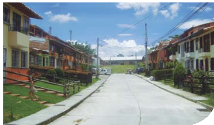
Barrio La Colina

Agregó Bautista, “todos ellos se benefician con tarifas muy competitivas, asimismo con nuestro portafolio de servicios, que comprende soporte de 24 horas para atender emergencias los 365 días del año; la ENERTIENDA, diseñada para mejorar el bienestar de nuestros clientes y sus colaboradores; capacitaciones básicas sobre ahorro de energía y uso racional y eficiente de la energía; y los programas de responsabilidad social que impactan en forma positiva a las comunidades de nuestros usuarios”.