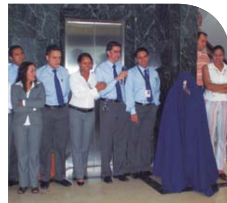
La propuesta escénica está dirigida a los clientes que deseen implementar estrategias URE en sus empresas.

Ellos, en ese corto tiempo, en un espacio casi vacío, arrancan sonrisas, pero también revelan un mensaje sobre la importancia del cuidado y la preservación del medio ambiente; promueven hábitos