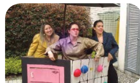
El equipo del centro médico escuchó atento los mensajes.