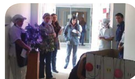
El personal interno de la Clínica de la Mujer, disfrutó de inicio a fin de la presentación teatral con consejos muy prácticos para evitar abrir en forma repetida la nevera y desconectar los equipos eléctricos cuando no están en uso.

Por su parte, el oficial de logística de la OIM, Rolando Serrano Agudelo, respaldó el trabajo de la comercializadora como un mecanismo importante para generar conciencia sobre las acciones que permiten mejorar la calidad de vida de los ciudadanos y contribuyen al medio ambiente: "con ese apoyo podremos mejorar y optimizar la energía con uso eficiente y aportar un granito de arena para el mejoramiento de las condiciones climáticas del planeta".