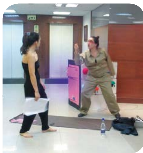
El orden en las salas de espera fue interrumpido por los intrépidos personajes, para llevar un mensaje positivo de uso energético.

Con el grupo de Teatro, Enertotal se hizo presente en la Semana de la Salud de la Clínica de la Mujer y en las capacitaciones programadas por la Organización Mundial de la Salud, OIM, para transmitir mensajes de ahorro de energía.