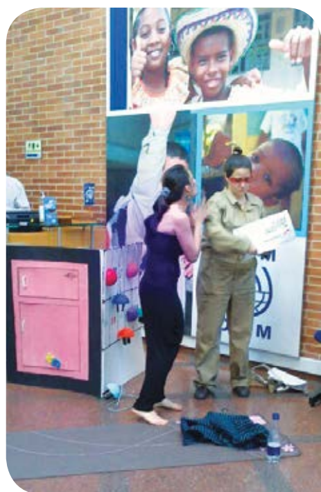
Con simpáticas piruetas irrumpió en las oficinas de la Organización Mundial de la Salud... la energía, protagonista de la obra.

Con el grupo de Teatro, Enertotal se hizo presente en la Semana de la Salud de la Clínica de la Mujer y en las capacitaciones programadas por la Organización Mundial de la Salud, OIM, para transmitir mensajes de ahorro de energía.