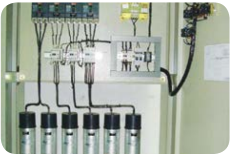
El sistema de banco de condensadores aumenta la tensión, la capacidad de las líneas y equipos eléctricos instalados; y reduce las pérdidas de la energía y el costo del servicio.

“Se incrementa la capacidad disponible de la instalación permitiendo atender alguna pequeña ampliación, sin necesidad de adquirir por ejemplo transformadores de mayor capacidad, además se debe tener en cuenta que mantener consumos elevados de energía reactiva puede ocasionar caídas de tensión superiores a las admitidas por los equipos y, en consecuencia, podrían presentarse dificultades en la operación de estos, incluso sobrecargas y sobrecalentamientos o paradas improductivas, estos son algunos de los elementos que bien aplicados en la industria conllevan a un uso eficiente y