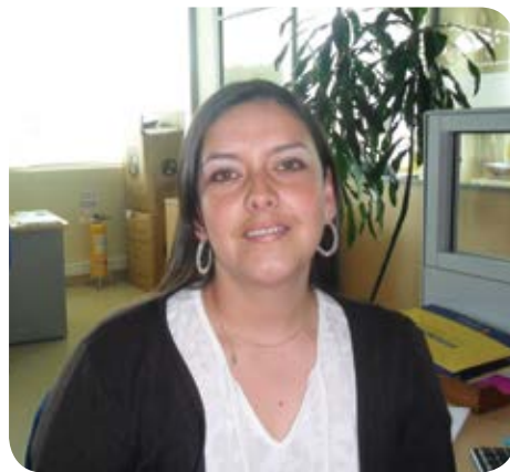
El equipo de la Dirección Comercial logró en tres días, impactar al 84% de los usuarios conectados.

Por su parte, la usuaria asociada al Centro Comercial Valle de Atriz señaló: “quiero agradecer por toda la información, de cómo debemos comunicarnos en caso de tener alguna sugerencia; estas jornadas nos permiten tener comunicación directa, fácil y efectiva con ENERTOTAL S.A. E.S.P. ”