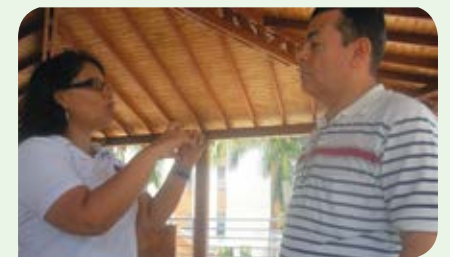
En el conjunto residencial Torres de Santorino en Cali, se dialogó persona a persona con el usuario.