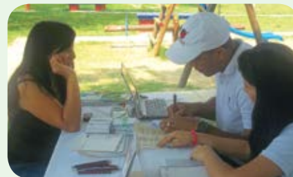
Presencia masiva de los vecinos de Ciudad del Campo, en Palmira, en la oficina móvil durante la jornada realizada en abril.

De esta manera llegamos a más de 20 mil usuarios en Colombia, con carpas, equipos de cómputo instalados; electrodomésticos de la ENERTIENDA de RAYCO-ENERTOTAL y espacios de capacitación sobre Uso Racional de Energía, para entablar un diálogo directo entre la empresa y nuestros clientes, en el cual expongan sus inquietudes, den sus sugerencias y tengan la posibilidad de ampliar sus conocimientos sobre servicios y facturación.